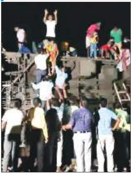
ओडिशा में कोरोमंडल एक्सप्रेस मालगाड़ी से टकराई: 8 बोगियां पलटीं, इंजन गुहस ट्रेन पर चढ़ा; कई यात्री घायल।